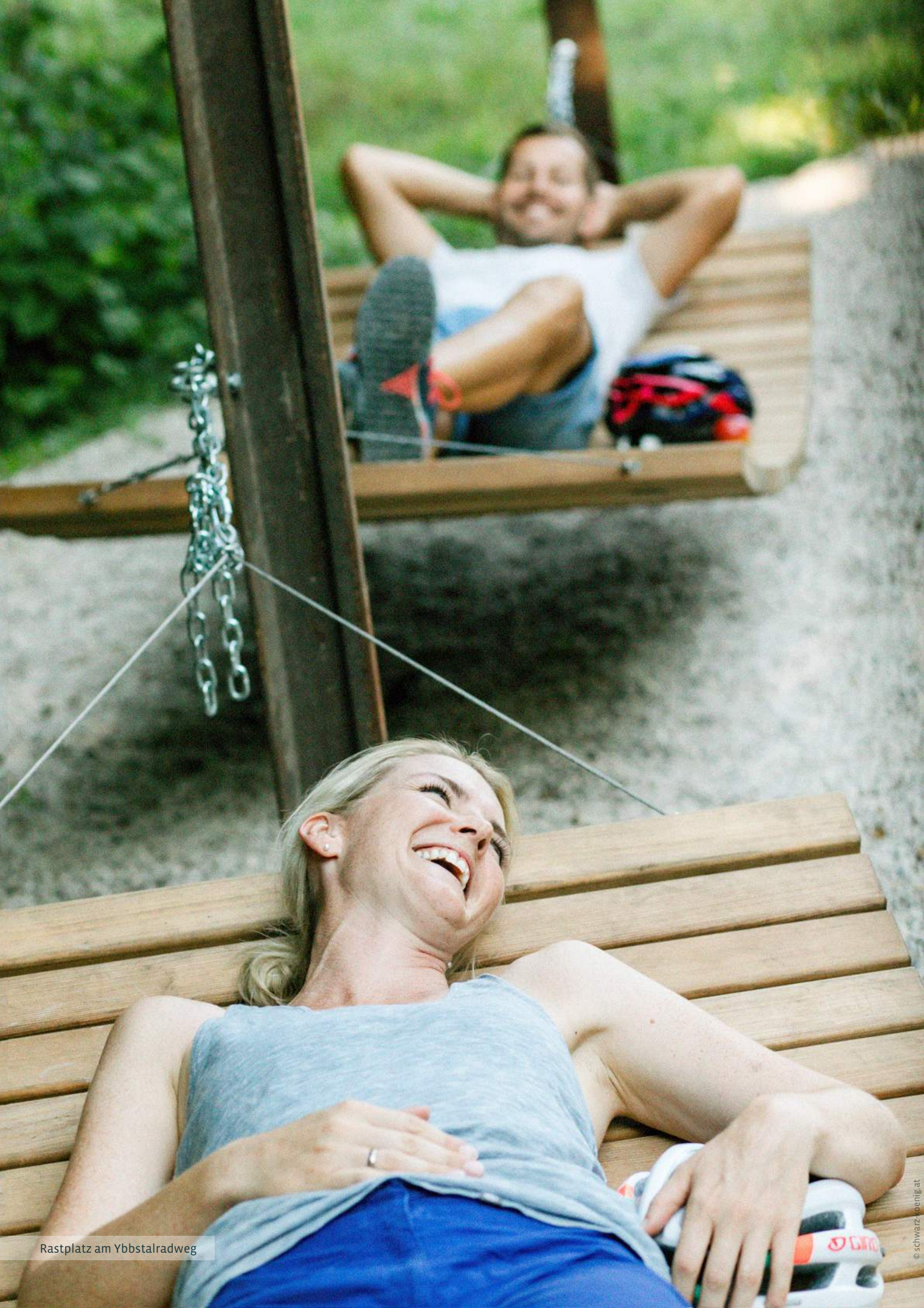
Rastplatz am Ybbstalradweg