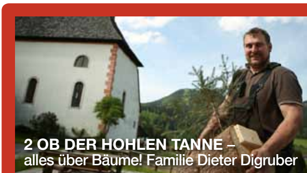
2 OB DER HOHLEN TANNE – alles über Bäume! Familie Dieter Digruber